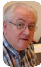
P.M.G.P. Bos Hoofd Maatschappelijk Werk

De gevaren van een open internetverbinding zijn in de media veelvuldig aan de orde geweest. Daar zitten twee kanten aan. Kinderen moeten enerzijds bij het ouder worden leren met vallen en opstaan hun eigen verantwoordelijkheid te nemen. Anderzijds: mag daarbij alles wat kan? Dat is een spanningsveld wat in een eerlijke sfeer onderling moet kunnen worden besproken, want tenslotte is een open internetverbinding voor veel ouders een (te) grote stap. De Schuilplaatscursus Opvoedingsondersteuning kan u daarbij wellicht van dienst zijn.