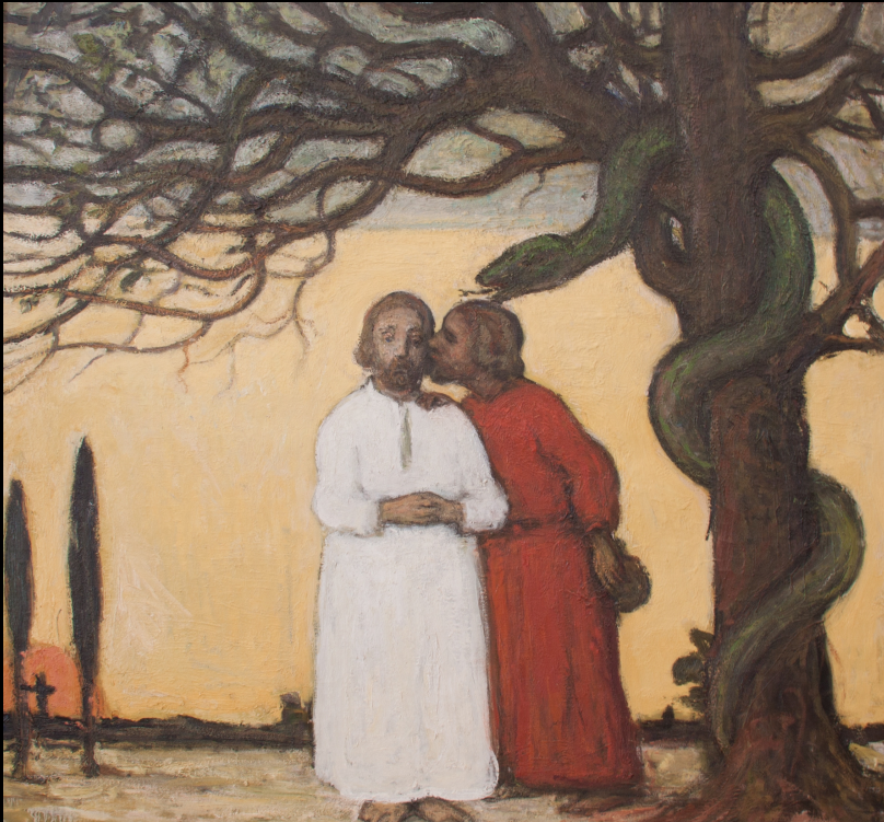
Jakob Smits: de Judaskus

Hij doopte een stuk brood in de schaal en gaf het aan Judas, de zoon van Simon Iskariot. Op dat moment nam de duivel bezit van Judas. Jezus zei: 'Doe maar meteen wat je van plan bent.' Niemand aan tafel begreep waarom Hij dit zei [...] Judas nam het brood aan en ging meteen weg. Het was nacht. (Joh. 13:26-28 en 30)